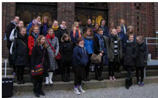
Ungdomskoret foran Evangelische Kirche Zum Heilsbrunnen, Berlin efter koncert 18. oktober 2010