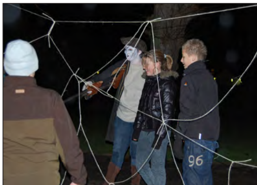
På natur med sognemedhjælperen...