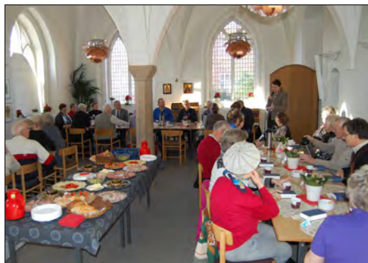
Kirkecaffe er populær...