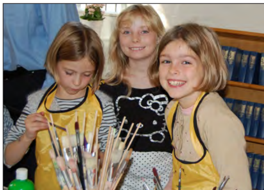
Børnekirke er sjov...