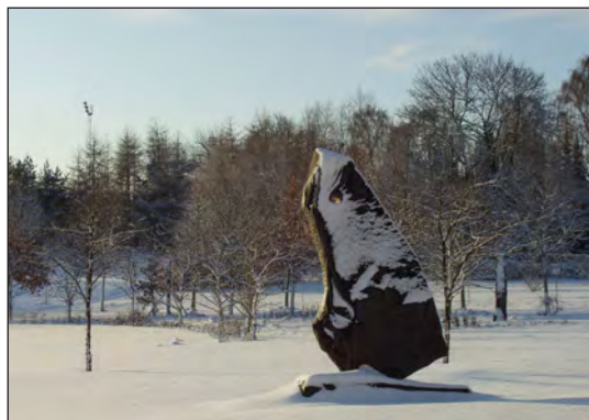
Vinter på kirkegårdene...